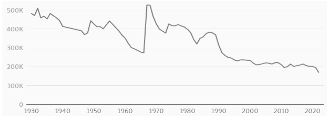
Grafic publicat de Europa Liberă – documente extrase de la INS (Andrei 2021)

În ultimii ani, mai puțin de 200.000 de copii s-au născut în România. Cu alte cuvinte, în cazul în care, peste aproximativ 20 de ani, trendul din ultimele decenii va fi păstrat, este aproape imposibil ca numărul studenților internaționali ce provin din România să depășească țintele asumate în cadrul Spațiului European al Învățământului Superior, ori ca numărul studenților români din Regatul Unit să treacă peste bariera de 20.000 de persoane pe an.